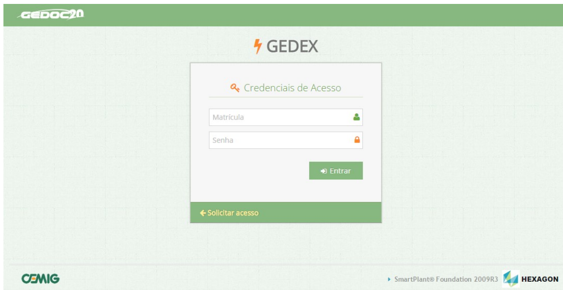
Figura 4 – tela inicial da ferramenta no sistema web