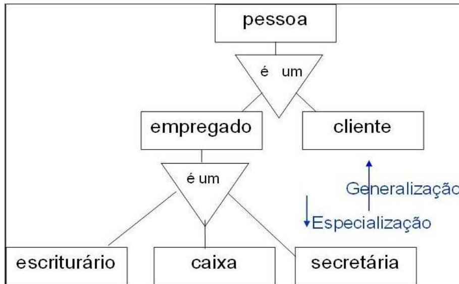
Figura 1 - Modelo representando uma herança entre a classe pessoa e suas subclasses