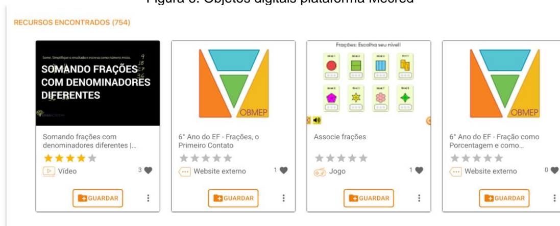
Figura 6. Objetos digitais plataforma Mecred