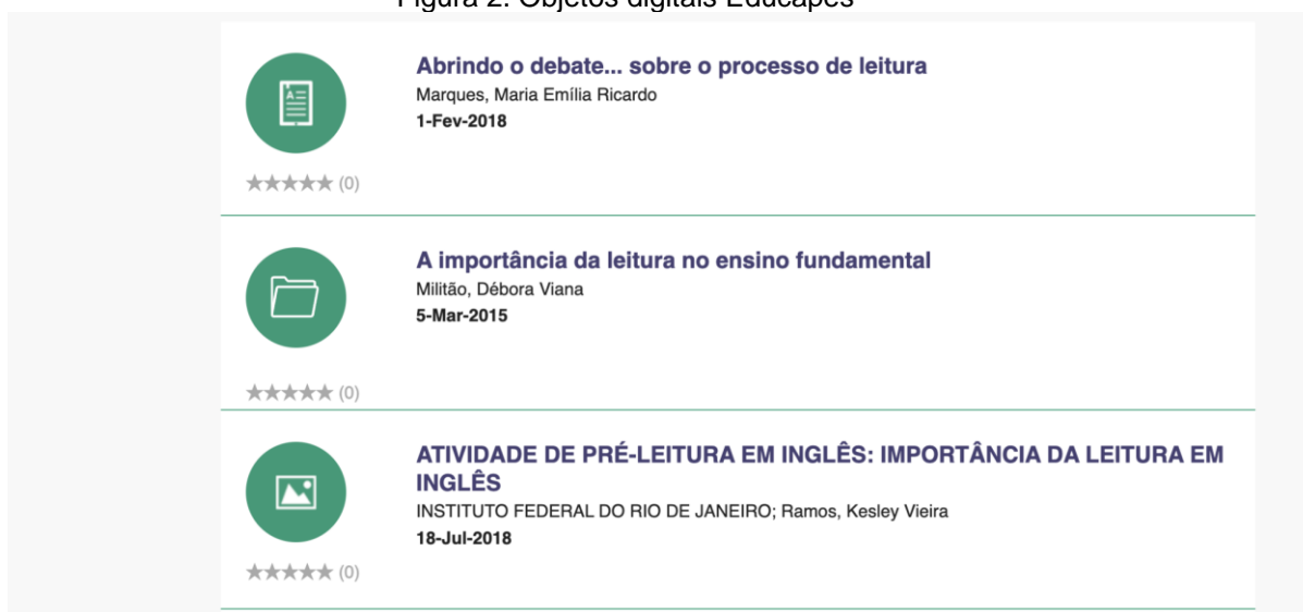
Figura 2. Objetos digitais Educapex