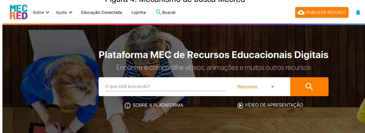
Figura 4. Mecanismo de busca Mecred